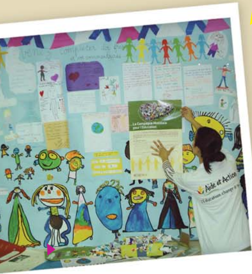
EXPOSITION DE DESSINS D'ÉCOLIERS

Voici quelques autres exemples de défis portés et réalisés par des enfants et des jeunes en faveur de l'éducation.