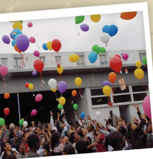
UNE CHAÎNE DE SOLIDARITÉ HAUTE EN COULEURS !

Chacun accroche à son ballon un petit message de solidarité. L'occasion d'exprimer une volonté, un sentiment, le désir de voir changer le monde.