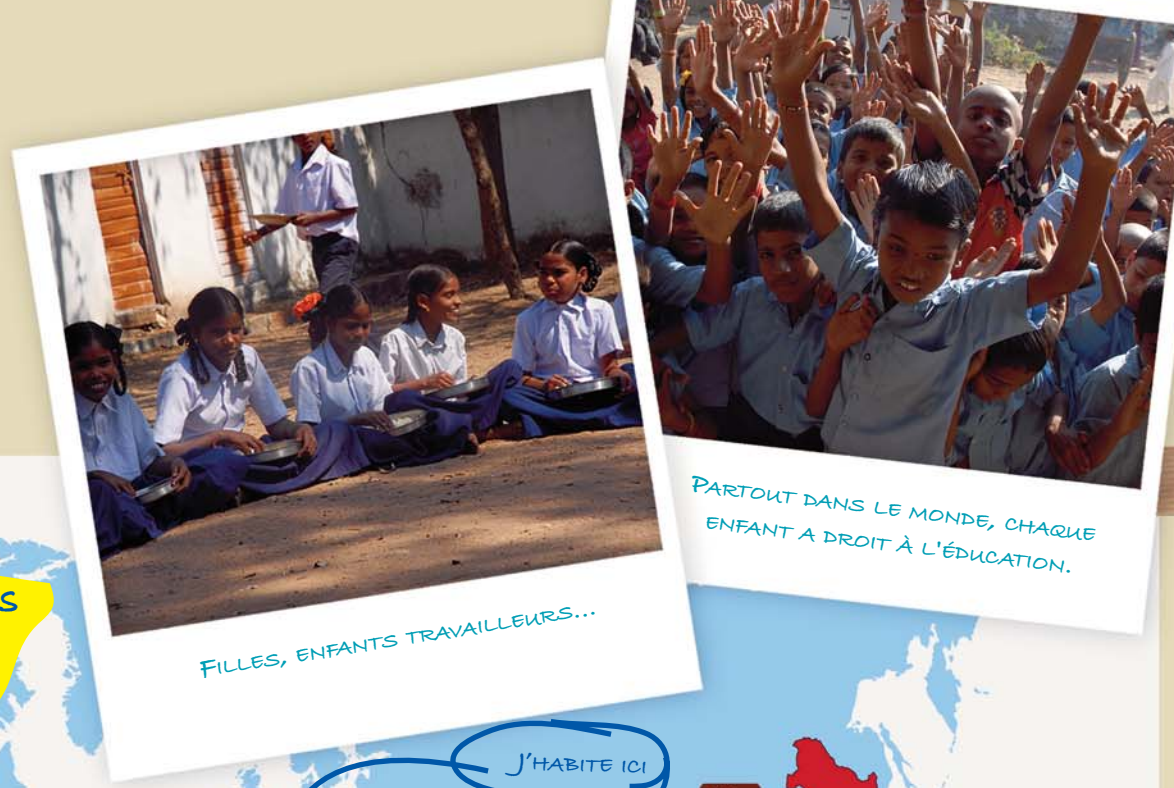
PARTOUT DANS LE MONDE, CHAQUE ENFANT A DROIT À L'ÉDUCATION.