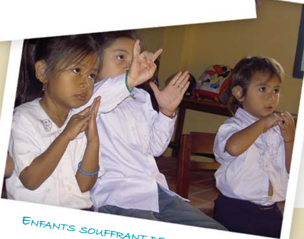
ENFANTS SOUFFRANT DE HANDICAP...