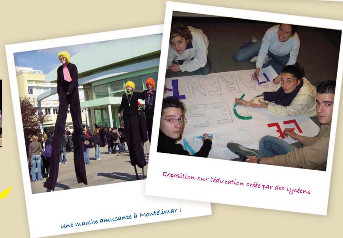
Exposition sur l'éducation créée par des lycéens