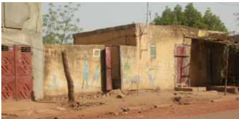
L'entrée de l'Association malienne de suivi et d'appui à la femme et à l'enfant (AMSAFE).

Le travail du clos a donc une double portée. S'il permet aux jeunes enfants de mieux appréhender le milieu scolaire tout en quittant la rue, il conduit les familles et surtout les femmes à dépasser leurs difficultés quotidiennes. Donner leur chance aux enfants en améliorant quelque peu la vie de leur famille est un mariage qui se veut réaliste. Avec des moyens réduits, les résultats sont convaincants. Des démarches politiques auprès des autorités jusqu'à la garde de petits enfants, l'AMSAFE vise une action complète. Le « clos d'enfants » est au centre du dispositif. Car c'est à travers la problématique de l'enfant que les familles abordent patiemment la globalité des problèmes qu'elles rencontrent. Ensemble, elles en prennent conscience et, ensemble, elles cherchent des solutions. ■