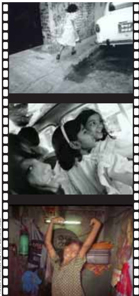
Photos extraites du film Caméra kids