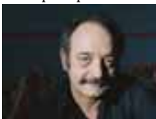
Louis Chedid, musicien.