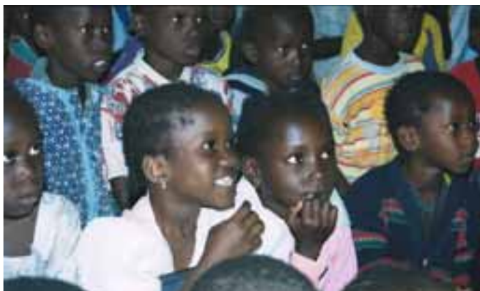
Des contextes différents mais des besoins identiques pour la Petite enfance.

Les données présentées sur cette double page proviennent pour la majorité de l'Institut de statistiques de l'Unesco ( http://stats.uis.unesco.org/ReportFolders/reportfolders.aspx ). D'autres sont tirées des sites internet des gouvernements concernés, ou du service statistique de la Banque mondiale. Elles sont particulièrement difficiles à collecter, surtout dans les pays en développement. Elles sont donc à considérer avec vigilance.