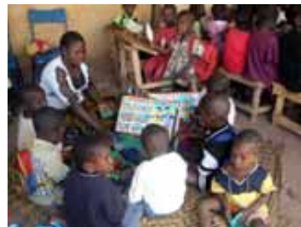
Le coin des petits : séance d'éveil sur le tapis.

Le Mali connaît un taux d'échec important à l'école et le clos permet d'envisager de le réduire. Il offre à ces enfants un premier contact avec un milieu et une activité proches du monde de l'école.