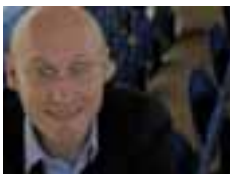
Bernard Laporte, sportif.