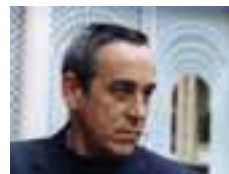
Thierry Ardisson, présentateur et producteur.