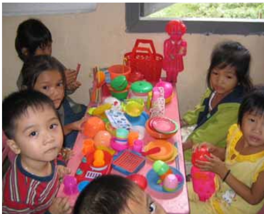
Au Vietnam, le manque d'enseignants oblige les enfants à ne venir que par demi-journées.

L'intérêt pour ce secteur ne cesse de croître et les avancées sont notables dans la prise de conscience. Mais on ne peut pas écarter la question des moyens. Le budget global de la France n'est pas comparable à celui du Sénégal. Et pourtant ce dernier consacre aujourd'hui 40% de son budget à l'éducation, grâce aux efforts impliquant les populations, les ONG, le gouvernement et les institutions internationales. Un cap à maintenir. ■