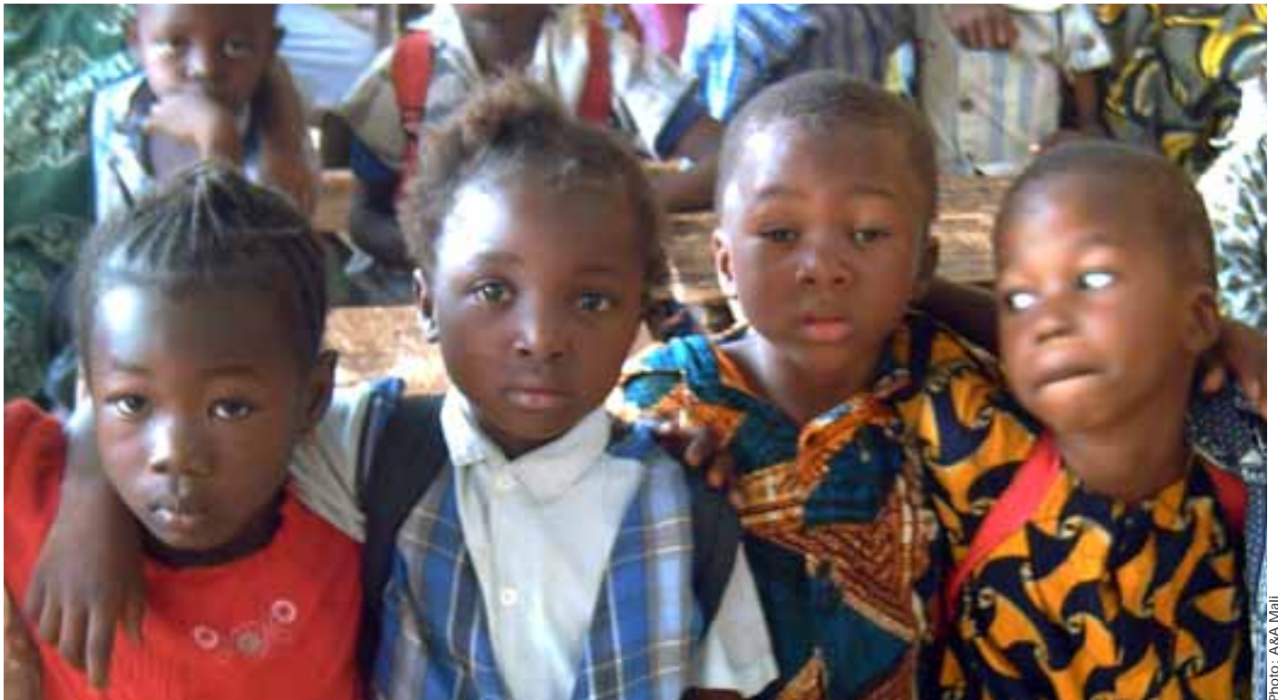
En maternelle, les enfants s'habituent à l'environnement scolaire.

Dans un quartier populaire de Bamako, une association réunit les familles pour l'avenir de leurs enfants. Au cœur de cette association, un petit clos d'enfants. Ici, le bien-être des plus petits améliore aussi la vie des plus âgés... Par Aide et Action Mali