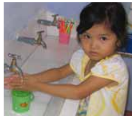
Au Vietnam, l'apprentissage de l'hygiène.

Cette mobilisation est une des principales clés du succès pour le développement de la Petite enfance. Mais pas la seule... Car si l'on parle de nécessité de prise en charge pour les tout-petits, encore faut-il s'intéresser à la qualité des programmes. Les enseignants ont-ils reçu des formations adaptées aux besoins spécifiques des plus petits ? Disposent-ils de tous les outils pédagogiques nécessaires ?