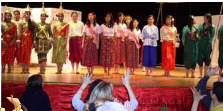
Les danseuses traditionnelles saluent le public.

d'une importante communauté cambodgienne, les rencontres avec des responsables d'Aide et Action Cambodge, le fait que l'une des bénévoles enseigne la langue des signes, tout cela a contribué au choix de l'équipe de soutenir le projet « Financement de l'école maternelle des enfants sourds de Chba Ampeou ». Ce dernier a, bien sûr, été longuement commenté, rappelant ses objectifs et ses moyens. L'équipe a aussi présenté l'association, notamment à travers sa Charte. Le plus dur a, sans doute, été de