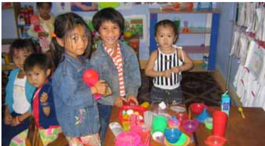
Le coin jeux d'une classe de maternelle au Vietnam.