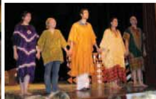
L'équipe de « La Malle à palabres ».