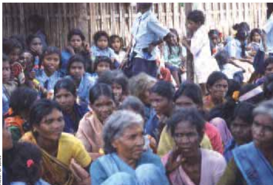
C'est à la communauté de décider si l'enseignant convient.