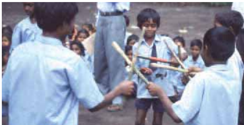
Le manuel scolaire tient compte de la culture tribale.

Environ 100 000 Jenu Kurubas vivent à la lisière des forêts de trois états du sud de l'Inde (Karnataka, Kerala et Tamil Nadu). Le mot d'ordre de la structure sociale de cette tribu est l'autogouvernance. Traditionnellement collecteurs de miel (signification de leur nom), les Jenu Kurubas vivent dans et de la forêt. Les politiques de création des parcs nationaux, au début des années 1970, ont provoqué leur expulsion de leurs milieux et ont brutalement marginalisé la tribu. Leurs codes sociaux, très différents, reflètent une vie proche de la nature. Les pratiques religieuses sont animistes et la discrimination envers les femmes est absente (les séparations, les remariages