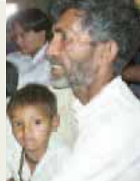
Les parents d'élèves sont les garants de la culture locale.