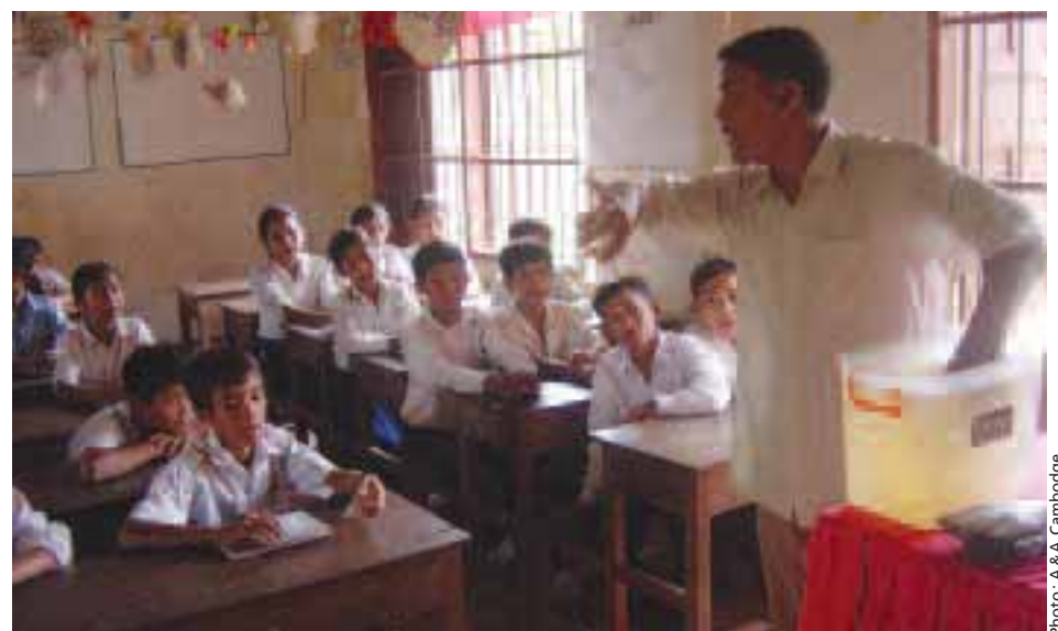
Grâce aux activités proposées par «La Boîte à outils», les enfants peuvent apprendre tout en s'amusant.