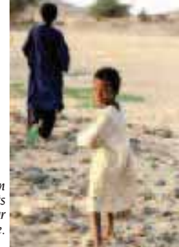
La scolarisation des enfants est menacée par la crise alimentaire.