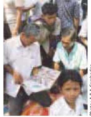
La redécouverte de la lecture au Cambodge.