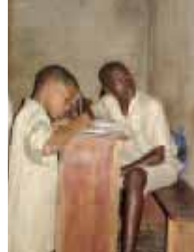
La nouvelle réforme met l'élève au centre de l'apprentissage.