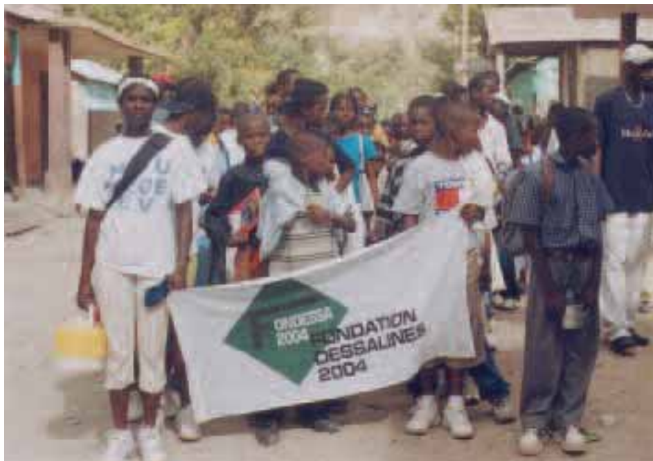
Des jeunes Haïtiens se mobilisent pour leur communauté.

Une fois formés, les jeunes des GVAC deviennent à leur tour animateurs. Ils se rendent dans les communautés et les écoles pour informer les citoyens de leurs droits, leurs devoirs et leurs rôles dans la reconstruction du pays. Très