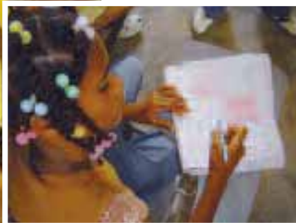
Les « Espaces pour grandir » accompagnent les enfants dans leur scolarité et réintègrent ceux qui en sont exclus.