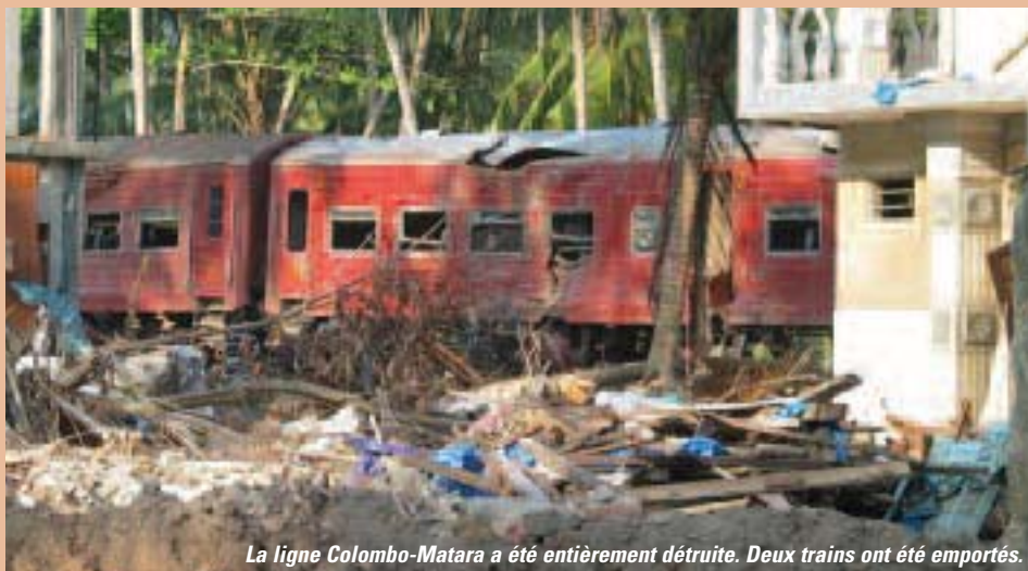
La ligne Colombo-Matara a été entièrement détruite. Deux trains ont été emportés.

Frappé de plein fouet par le raz-de-marée, le Sri Lanka est en reconstruction. Les priorités sont le retour à l'école et la relance des activités économiques. L'objectif : accompagner la post-urgence pour faire un réel travail de développement.