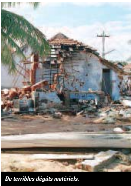
De terribles dégâts matériels.

Un premier axe concerne l'assistance psychologique et sociale. Passé le choc, les survivants sont confrontés à des situations de détresse intense. Tous ont perdu des proches, des enfants, des amis. Les actions concernent donc l'établissement de centres de ressources et d'information, la formation de bénévoles pour les activités scolaires et l'écoute des familles. 10 000 familles sont concernées.