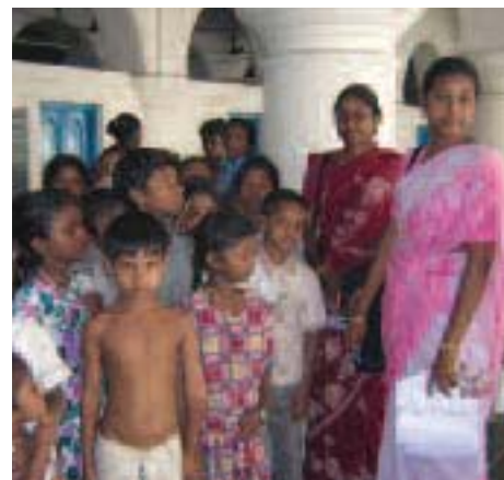
Femmes et enfants sont parmi les plus fragiles.

Enfin, l'État du Tamil Nadu et l'État indien ont mis en place des programmes d'aide à la reconstruction de l'habitat et des équipements. L'association suivra dans ce cadre plusieurs projets, dont la reconstruction ou la réhabilitation des bâtiments scolaires (35 écoles) et de 7 centres communautaires ainsi que la fourniture d'équipements sanitaires.