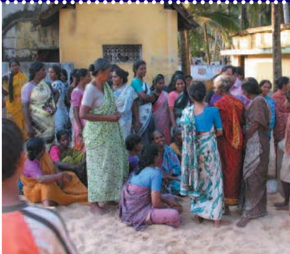
Les femmes expriment leur volonté de reconstruire leur communauté.